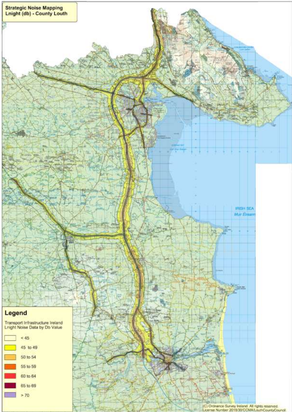
Figiúr 11.1: Plean Gníomhaíochta in aghaidh Torainn - Bealaí Laistigh de Chontae Lú