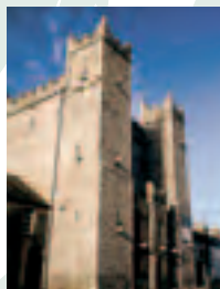
Barr: Tarbhealach Mhic Néill thar an mBóinn, Droichead Átha