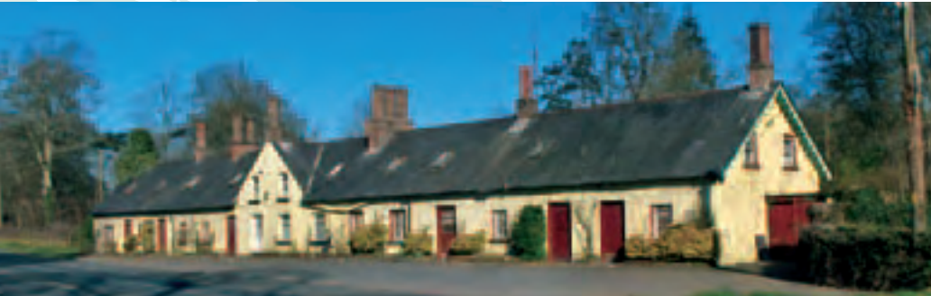
Barr: Bailtíní Bhaile Mhic Scanláin