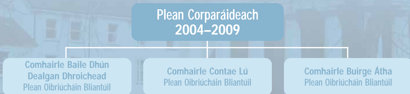
Fíor 1: Próiseas Ullmhúcháin don Phlean Corparáideach (cairt)

Trínár nGrúpa um Beartais Chorparáideacha (GBC), ár gCoistí um Beartais Straitéiseacha (CBS), ár gCoistí um Beartais Chathracha agus fochoistí éagsúla maoirseoidh agus feidhmeoidh Comhairleoirí agus an Fhoireann Bainistíochta feidhmiú an Phlean seo trí na Stiúrtóireachtaí éagsúla. Gach bliain, aibhseofar dul chun cinn ar gach ceann de na spriocanna agus cuspóirí seo sa Tuarascáil Bhliantúil.